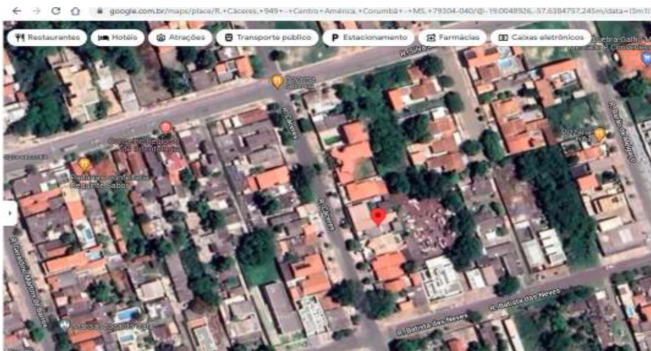
IMAGEM 1: GOOGLE MAPS

LOCALIZAÇÃO/CARACTERÍSTICA: O imóvel está localizado na rua Cáceres, nº 949, entre as ruas Silva Jardim e Batista das Neves, em área predominantemente residencial da cidade e afastada da região central comercial da cidade. De fácil acesso e servido de toda infraestrutura, tais como redes de água, luz, internet, telefone, coleta de lixo, transporte público, farmácias, supermercados, escolas, lojas, Igrejas, etc.